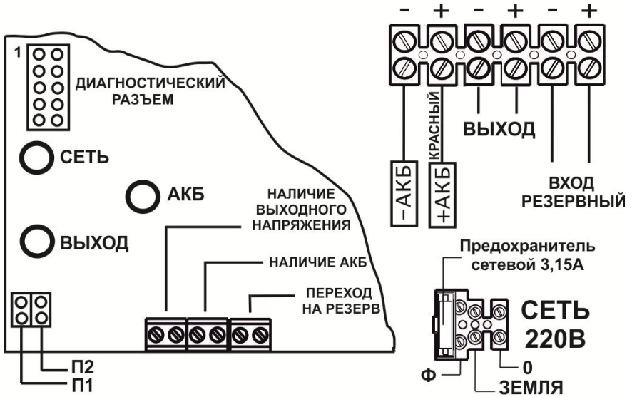
Рисунок 1. Вид источника с открытой крышкой (схема подключения)